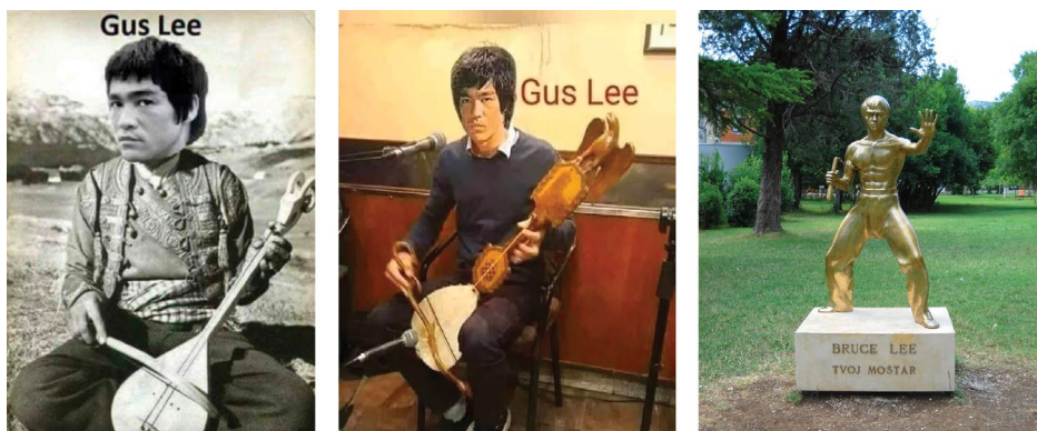
Slika br. 3 – Gus Lee 12

Treću grupu čine mimovi koji govore o savremenom i repertoarskom okviru, načinu stvaranja pjesama i problematici (muzičke) opreme. Riječ je o predstavljanju „degradacije“ guslarskih pjesama danas za razliku od pjesama iz doba SFRJ, ubacivanja različitih pošalica, stihova lascivnog sadržaja i slično, što je i u prošlosti takođe bio slučaj, ali se takvom sadržaju nije pridavala veća pažnja jer se istaživala „čista“ epika. Uzevši u obzir oralnost kao jednu od najvećih karakteristika gusala i (epske) narodne poezije, stvaranje pjesama i „anonimnih“ autora isticanjem kolektiviteta, na humorističan način prikazan je npr. Filip Višnjici i vojnik – hroničar. Oni su „chad slepi guslar vs. virgin istoričar“ gdje vojnik naređuje „starini“ Višnjicu da „stavi u pesmu“ borbu i hrabrost Vuka Brankovića i izdaju Marka Mrnjavčevića jer od toga zavisi nacionalna istorija. To nam govori i o relacijama izvođač-stvaralac, direktnom komunikacijskom procesu i izvedbenom činu, pri čemu se kultura posmatra kao (ne)formalno ljudsko ponašanje koje muziku čini faktorom u komunikacijskim relacijama u društvu (Lajić-Mihajlović 2008, 226–227; Antonijević 2023, 147; Bleking 1992, 18).