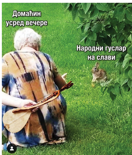
Slika br. 5 – Guslar na slavi 14

cija za takav mim. Radi se o slikovnom mimu gdje domaćin „usred večere“ moli guslara „da zapjeva“ i daje mu gusle, dok guslar preplašen poput prikazanog zeca bježi od forsiranja takve situacije i pokušava da je izbjegne. Taj primjer nam govori i o predstavljanju guslarske prakse kao uže lokalnog i ličnog značaja za pojedince, ali i o doživljaju pomenutog skupa i prostora „kod domaćina“ kojima se upisuju nova značenja, kao što je to slučaj na primjeru „džez muzike na otvorenom“ (Ajduk, Milosavljević i Banić Grubišić 2023).