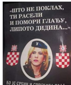
Slika br. 2 – Govedarica vs. Cvijanovička 10

Još jedan od pokazatelja „spajanja“ ali i „borbe“ za pitanje čije su gusle predstavljaju mimovi posvećeg „Gus Liju“, odnosno Brus Liju koji gusla. U pitanju je „(staro)hercegovačko-crnogorska“ verzija Gus Lija predstavljenog u narodnoj nošnji i ambijentu na otvorenom na Durmitoru, dok je druga verzija (zapadno)hercegovačkog „Gus Lija“ koji nastupa u savremenom kontekstu, „u civilu“, svirajući gusle na kojima se nalazi i šahovnica – jedan od simbola Hrvata u Bosni i Hercegovini. Na prvi pogled može se postaviti pitanje kakva je poveznica Brus Lija sa guslama i guslarskom praksom, sem igre riječi?! Mogući odgovor se krije u spomeniku Brus Liju 11 kao „neutralnoj“ osobi prihvatljivoj za sve, i to upravo u etnički podijeljenom Mostaru (Dražeta 2021, 2024) ili možda u paroli „Srbija do Tokija“.