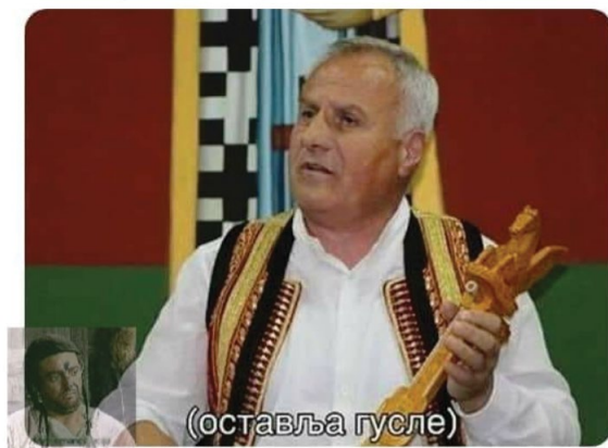
Slika br. 4 – Autoplej 13

Posljednju grupu internet digitalnih sadržaja u ovoj popularnoj formi čine mimovi o upotrebi i funkciji gusala, tačnije guslarskim praksama koje podrazumijevaju muzičke i vanmuzičke elemente poput vježbanja, nastupa, mjesta okupljanja i druge infrastrukture (Cohen 1993, 1995) i različitih muzičkih žanrova i gusala. Jedan od mimova predstavlja „to doba godine“, tačnije jesen i ježa u kućici koji izbjegava sve zabavne sadržaje koje nudi vikend – od različitih žurki, izlazaka do odlaska kod djevojke koja mu poručuje „Sama sam kući“, i sve to zanemaruje i odlazi na guslarsko veče sa specijalnim gostom Đorđijem Koprivicom. Pojava guslara „zvijezda“ nije nova i nepoznata pojava, već se i u ovakvim slučajevima koristi kao „mamac“ za što veći broj publike (Murko 1951, 213–215; Lajić Mihajlović 2014, 69–71; Guja 2021, 86–87; Guja Dražeta 2023, 343), što, između ostalog, uzrokuje međusobno nadmetanje i konkurenciju ko je „najveći čuvar“, „baštinik“ i „izvorni“ guslar (Antonijević 2023, 103–104; Bošković-Stulli 1983, 226–227). Upotreba gusala u savremenoj praksi ogleda se u sklopu guslarskih večeri, regionalnih, republičkih i saveznih festivala, smotri i sabora izvorne muzike, na svadbama i slavama sagledana je kao muzička praksa i „sredstvo okupljanja i snažnog povezivanja“ (Ober 2007, 9), što je bila inspira-