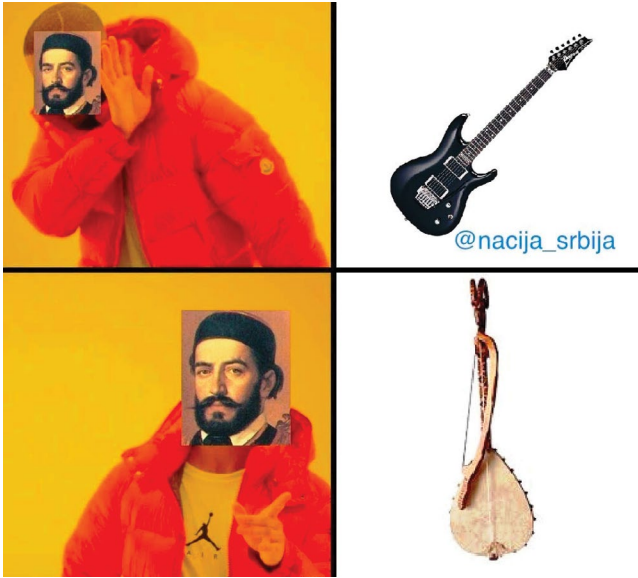
Slika br. 1 – Njegoš 9