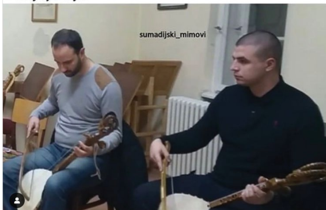
Slika br. 6 – Kumovi 15

Poznato da je da se kultura u širem smislu posmatra kao (ne)formalno ljudsko ponašanje koje muziku, (samim tim i gusle kao dio tradicionalne muzike, dodala Z.G.D.), važnim činiocem u komunikacijskim relacijama u društvu (Bleking 1992, 18) koje može služiti i za opisivanje različitih osjećanja i stanja, muzičkih ukusa, odnosno stilova i žanrova muzike. Neki od takvih primjera mimova su oni gdje se na postavljeno pitanje „Šta slušaš?“ daje odgovor: „Otkud znam šta slušam, ja sam labilna ličnost, još samo gusle što ne slušam, a nije isključeno da i to počnem“ ili slučaj kada djevojka tjera momka da slušaju Kikija Lesendrića i Pilote (pop-rok izvođače), a on se po povratku kući „detoksikuje“ guslama. Još jedna „detoksikacija“ guslama jeste mim gdje je prikazan medijski eksponirana ličnost Miroljub Petrović koji djetetu svira gusle i govori mu „sada spavaš u beta režimu“ aludirajući na moć frekvencija i snažnu moždanu aktivnost, povišenu svjesnost, koncentraciju koje u budnom stanju daju beta talasi. Pored toga, Petrović često na negativan način pominje „alfa režim“ u kojem