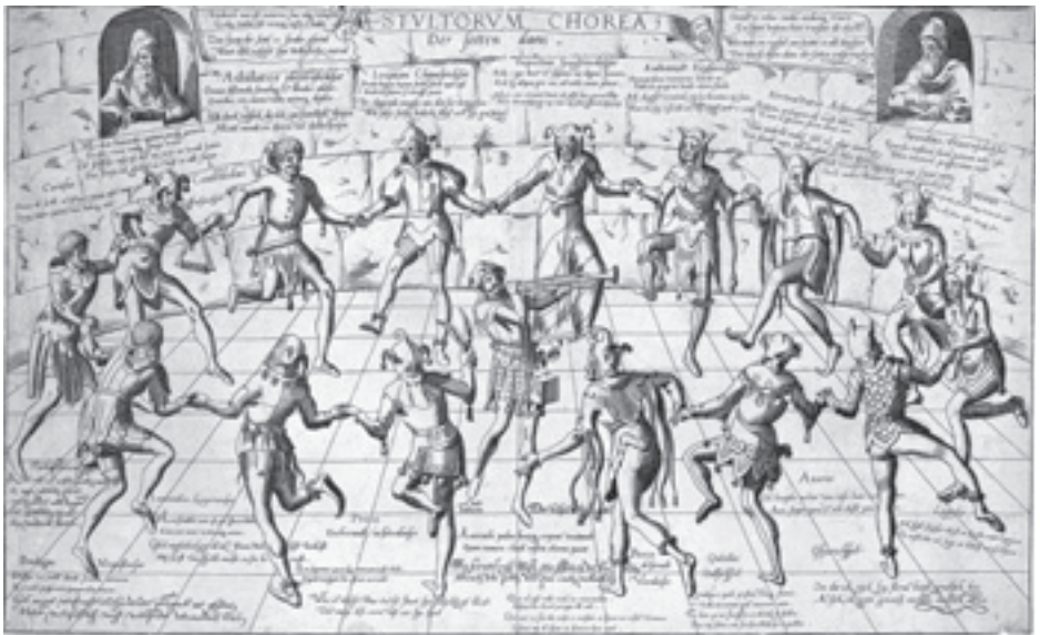
Sl. 4 – Oko Lude-trubača pocupkuje u kolu čak trinaest tipova Luda: Udvorica , Brlbljivac , Obesnik , Slavoljubivac , Potcenjivač/Klevetnik , Zavidljivac/Zlobnik , Lenjivac/Kukavica , Tvrđica/Srebroљubac , Proždrljivac , Razbludnik , Rasipnik , Ljubopitљivac/Radoznalac , i Svadjlivac (Hogenberg ca. 1560–70).

Savremenik Žana Gormona koji je uradio duborez „Karta sveta u glavi Lude“ (sl. 1), bio je nizozemski graver Frans Hogenberg (1535–1590), i ovde je značajan ne samo zbog toga što je bio svedok i slikar mračnih vremena građanskih i verskih ratova u Francuskoj i nizozemskim komunama, već zato što je iznedrio