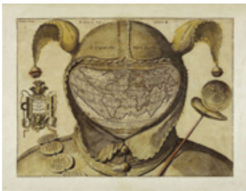
Sl. 3 – Primerak mape O caput elleboro dignum [Monde dans une tête de fou], u Nacionalnoj biblioteci Francuske (ca. 1590), italijanska radionica (Anon., 1590).

ka. Gormonova karta sveta i citat iz Plinijeve „Prirodne istorije“ tik iznad lica, preuzeti su iz zbirke karata Abrahama Ortelijusa (1527–1598) „ Teatrum Orbis Terrarum “ ( Pozornica zemalja sveta ) iz 1570. godine, štampane u Antverpenu