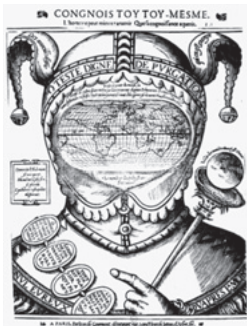
Sl. 1 – Mapa Žana II Gormona iz oko 1575. godine (Hofmann 2007)

Kompoziciono, vizuelno i alegorijski, karta sveta na licu Lude ostaje jedna od najintrigantnijih primeraka kartografske umetnosti. Sačuvana je u dve glavne varijante, prvobitno drvorez (ksilografija), a potom bakropis, u nekoliko izdanja. Najstariji primerak je karta izrađena tehnikom drvoreza pariskog štampara Žana II de Gormona (Jean II de Gourmont, ca. 1537–1598), iz oko 1575. godine sa naslovom: Congnois toy toy mesme. L'homme ne peut mieux parvenir / Que sa cognoissance aquerir („Spoznaj samog sebe. Čovek ne može više uspeti osim ako ne dostigne samospoznaju.“ (sl. 1), i duž ruba kape O teste digne de purgation , odnosno „O glavo treba ti pročišćenje“, što se odnosi na dejstvo napitka od kukureka ( helleborum ), kako stoji na istoj poziciji na bakropisnoj mapi (sl. 3). U poređenju s ovim poznijim bakropisom, kompozicija je sasvim slična, osim što je na drvorezu prikaz šake leve ruke s uperenim kažiprstom ka medaljonima i ka kartušu na levoj strani. Dodatak je i traka ispod medaljona sa tekstom „Nul [h]eureux qau'apres la mort“, „Niko nije srećan osim posle smrti“, koji je verovatno uzet iz Solonomonovih izreka. Svi tekstovi su na francuskom, i luđin skiptar ima malu, nekakvu dlakavu glavu, ispod dis-