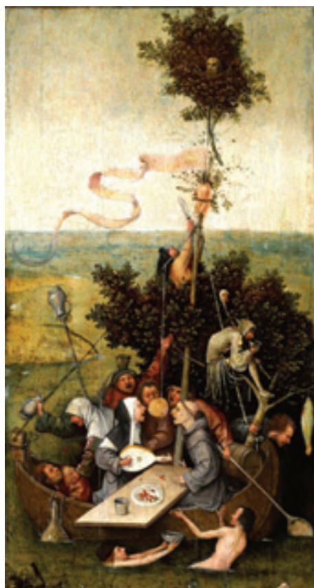
Sl. 9 – Hijeronimus Boš, Brod ludaka (ca. 1500–1510)

Brantove Lude su ukrcane na brod koji plovi za Naragoniju, mitsku zemlju – ostrvo poput kasnije stvorene Utopije Tomasa Mora (1511), i ludaci će „ploviti“ sve dok ih, kako je Mišel Fuko istražio, državna vlast ne bude okupila i konfirirala u „bolnice za uma sišavše“, u toku perioda „Velikog zatvaranja“ tokom klasicizma (Foucault, ed. Khalfa 2006). Hijeronimus Boš (o. 1450–1516) iz katoličkog Brabanta je svakako bio inspirisan Brantovim delom kada je oslikao ovaj deo triptiha oko 1500–1510. godine, u sličnom diskursu o gresima smrtnika svih fela i staleža.