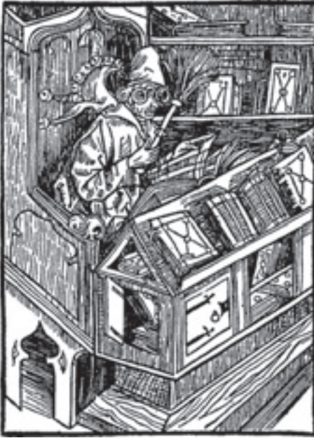
Sl. 6. – Luda okružena knjigama, Brandt (1494)