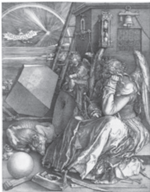
Sl. 12 – Direrova krilata Melanholija I, paradoksalno tako laka, a tako teško pada na obolele

...U starom znanju u kome se mikrokosmos i makrokosmos preslikavaju u suglasju između psihologije i astrologije, između raspoloženja, temperamenata, planeta, konstelacija, priroda Merkura je najnedefinisanija i najpromenljivija. Ali, po najrasprostranjenijem mišljenju, temperament pod uticajem Merkura, okrenut ka razmeni i trgovini i okretnosti suprotstavlja se temperamentu pod uticajem Saturna, melanholičnom, kontemplativnom, usamljenom. Od davnina se smatra da je saturnovski temperament tipičan za umetnike, pesnike, mislioce, i čini mi se da to odgovara istini. Naravno, književnost nikada ne bi postojala da jedan deo ljudskog roda nije bio okrenut ka introspekciji, nezadovoljan svetom onakvim kakav jeste, zaboravljajući na sate i dane, i držeći nepomičan pogled na nemim nepokretnim rečima. Naravno, moj karakter odgovara tradicionalnim osobinama te kategorije kojoj pripadam: i ja sam oduvek saturnovac, bilo kakvu drugu masku da sam nosio. Moj kult Merkura odgovara možda samo nekoj težnji, nečemu što bih želeo da budem: ja sam saturnovac koji sanja da je merkurovac, i sve ono što pišem trpi ova dva uticaja. (Kalvino 1989)