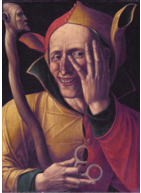
Sl. 7 – Portret Lude, Jakob Kornelis (ca. 1530)

kakve staleške, to će reći, društvene konvencije, te uzdignute batine u desnoj ruci, ova Ludost, nalik možda na antičkog Herakla sa batinom, okrenuta je ka višnjem sagovorniku, slično glavnom disputatoru, poricatelju Boga, Luciferu, i njen opozicioni par je Razboritost, moralna ispravnost i činjenje ( Prudentia ). U susednim nišama je i freska greha Očajanja (što odgovara apatiji, lenjosti duha i tela, slaboj volji – Acedia ), Nepostojanosti ( Inconstantia , što je možda blisko prevrtljivosti, moralnom oportunističkom i izdajstvu kod Dantea, jer joj je nasuprot Istrajnost – Fortitudo ), i Nepravda, uz one već poznate – Zavist, Gnev, Nevera. Zapravo je Đoto smelo izbacio četiri kardinalna greha da bi napravio svoju autentičnu seriju, budući da nedostaju Oholost ( Superbia ), Pohlepa ( Avaricia ), Požuda ( Luxuria ), i Proždrljivost ( Gula ). Dok su druge freske u kapeli izvedene u živopisnim bojama, ove moralne poduke pastvi odlučio je da prenese u mroznim, sivim tonovima, slično karti sveta u glavi Lude (sl. 3), te bi se moglo pomišljati da ni izbor boja na karti nije bio slučajan, već vrlo osmišljen, posebno ako se uzme u obzir ikonografska raskošnost mapa tokom 16. veka, gde sve blješti od boja i pozlate (Lackey 2005).