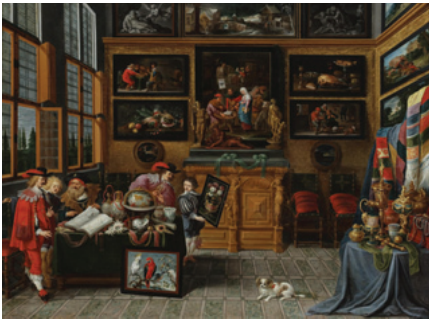
Sl. 11. – Pozornica „taštine” u „Galeriji kolekcionara slika i objekata“, Kornelis de Belieur (Cornelis de Baellieur), o. 1635–40. (Baellieur, Wikimedia)