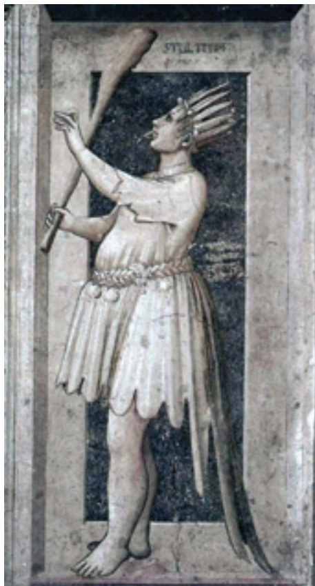
Sl. 5 – Đotova freska Ludosti, kapela Arena u Padovi (1308)

Znatno pre nego što je Erazmo ispisao u jednom dahu „Pohvalu ludosti“ u skeptičnom i sekularnom duhu, Đoto je oslikao fresku greha Ludosti ( Stultifera ) (sl. 5) u Arena kapeli u Padovi 1308. godine, u okviru ciklusa o Sedam grehova, levo, i Sedam vrlina, desno od oltara. Njegov izbor grehova je posve originalan, jer odstupa od uvrežene liste sholastičkih filozofa – Đoto je priključio Ludost u biblijskom smislu bezumnosti, negiranje Boga i Hrista Spasitelja. Uzdignute glave sa čudnom kićankom i čudnovatim kostimom koji odstupa od bilo