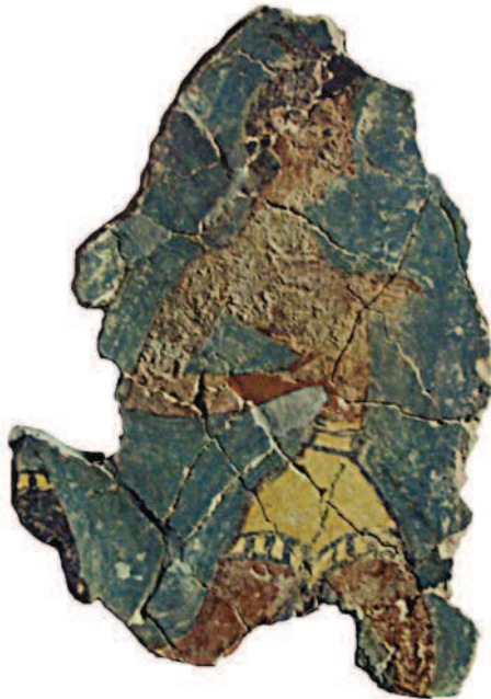
Slika 1. Fragment freske "Kapetan crnaca" (Hafner 1968)