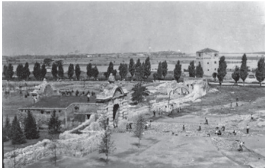
Slika 5. Radovi „čišćenja“ na Kalemegdanu, 1941. ili 1942. godina, ANM

Zbog početka Aprilskog rata 1941. godine, projekat je zaustavljen, no, ostala je ideja. Tu ideju, kada su se stekli uslovi, počeo je da sprovodi u delo Johan Albreht fon Rajsvic (J. A. von Rechwitz, 1899–1962), koji je tokom rata postavljen kao savetnik pri vojno-upravnom štabu u Beogradu, a osnovana je i posebna služba za zaštitu umetnina i spomenika kulture ( Kunst und Denkmalschutz ), kojom je upravljao. Rajsvic je na različite načine bio zainteresovan za istoriju i arheologiju u Jugoslaviji tokom treće i četvrte decenije XX veka. Između ostalih aktivnosti, zajedno sa Miodragom Grbićem (1901–1969) i Vilhelmom Unfercagtom (W. Unverzagt, 1892–1971) iskopavao je Gradište iznad crkve Sv. Erazma na Ohridu 1931/1932. godine (Bandović 2014, 629–630; 2016, 837–838; Kott 2017, 250). Ovde je potrebno istaći da je Rajsvic bio upoznat sa Marhovim planom i idejama koje je imao DAI, pa se zajedno sa Unfercagtom, pominje i kao potencijalni saradnik pomenutog projekta. 35 Odmah nakon uspostavljanja službe Kunstschutz -a, Rajsvic je započeo „radove raščišćavanja“ ( Aufräumungsarbeiten ) u Donjem gradu Kalemegdana (Slika 5). Podršku je pritom našao i među lokalnim stručnjacima. Miodrag Grbić, njegov raniji saradnik, kustos Muzeja, a tokom rata i referent za Muzeje u Ministarstvu prosvete, bio je odmah angažo-