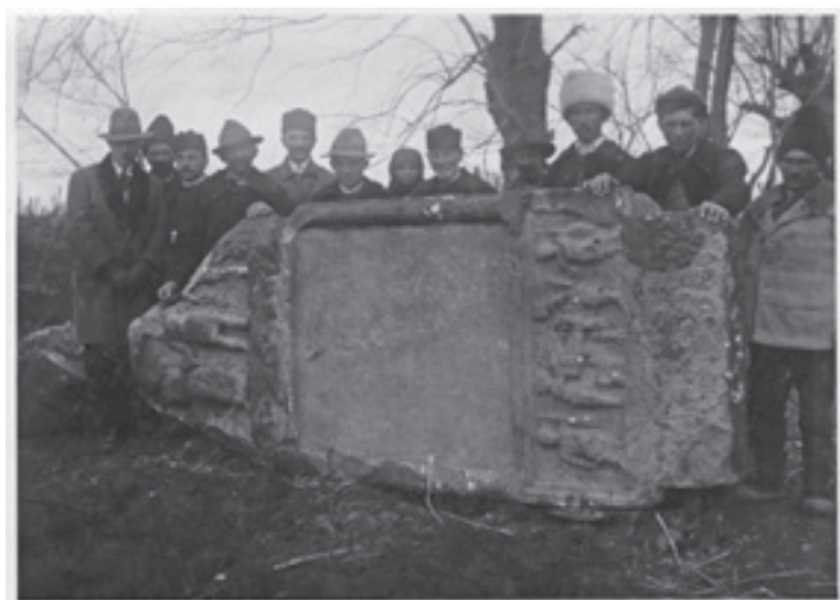
Slika 1. „Otkriće“ spomenika na Viminacijumu, početak XX veka, ANM

Iako je na iskustvenom nivou odnos između fizičkih radnika i arheologa daleko kompleksniji, a različite interakcije premošćavaju podelu između intelektualnog i manualnog rada (Schlanger 2016), u arheološkim publikacijama ta činjenica se vrlo retko eksplicira. Kako bi trebalo da tretiramo ovo saznanje? Da li kao otuđenje rada o kome je pisao Marks (K. Marx, 1818–1883)? Podsetiću da je Marks u tezama o otuđenom radu pisao o tome da je čovek „generičko biće“, biće koje se ostvaruje kroz plodove sopstvenog rada. Ono što je kapitalistički način privređivanja doneo jeste upravo otuđenje rada. Čovek ne radi da bi se afirmisao kao biće kroz rad, već da bi preživeo (Marks 1963 [1844]). O otuđenom radu nije samo Marks pisao, štaviše, u poređenju sa Marksom, Adam Smit (A. Smith, 1723–1790) je ostavio beznadežan prikaz otuđenja rada u fabrikama tokom industrijske revolucije (Svensen 2012, 42–45). Da li je arheološki teren kroz istoriju arheoloških istraživanja bio takvo mesto gde možemo prepoznati otuđenje rada, kako nas neki autori upozoravaju (Mickel 2019)?