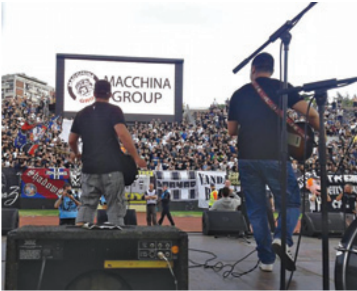
Slika 1. Koncert grupe JNA na Stadionu Partizana tokom trajanja fudbalske utakmice između Partizana i Spartaka iz Subotice, prilikom proslave osvojene titule 2013. godine

Fanzini 10 su značajna karika koja spaja pank i navijačku subkulturu. Pank je prvi objavio rat tradicionalnim medijima i pozvao mlade da preuzmu inicijativu, a vremenom su se kreatori muzičkih fanzina tokom osamdesetih godina dvadesetog veka, sa usko muzičkih tema masovno preorijentisali na fudbal (Kostić, Mihajilović i Vuković, 5). Iako se virus panka i fanzinaštva širio jako sporo ka kontinentalnom delu Evrope, navijači Partizana su bili prvi, daleko najproduktivniji i najkreativniji na prostoru bivše Jugoslavije na polju stvaranja ovakvih časopisa (Kostić, Mihajilović i Vuković, 6–9). U novembru 1995. godine izašao je prvi broj fanzina Daj gol , nastao po ugledu na engleski Sniffin' Glue i nastavio da izlazi tokom naredne dve godine. Pratili su ga brojni naslednici, koji su bili različitog kvaliteta i trajanja, ali su fanzini i danas ostali značajan kanal izražavanja navijača Partizana. 11 Koautor knjige Punk u Yu 1980–90 , Dejan Šunjka, ističe: