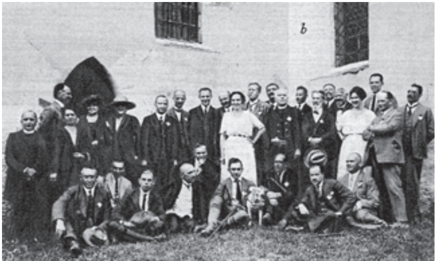
Slika 1. Skup arheologa u Dobrni kod Celja (Ilustrovani list 1922a, 13)