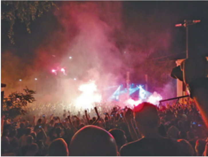
Slika 2. Koncert Grupe JNA održan 8. septembra 2019. godine u dvorištu osnovne škole Mihailo Petrović Alas na Dorčolu, u okviru manifestacije Dorčolski festival – porodična tradicija koju su organizovali GTR i Grupa JNA

Kada je reč o vrsti emocijama koje se pominju u pesmama Grupe JNA, najčešće su to ponos, vernost, večita ljubav (na primer, u stihovima kao što su: „Grobari to smo mi, zauvek verni našem Partizanu, i nema kraja našoj ljubavi, Grobari to smo mi“; „Prošlo je mnogo godina, ništa nije se promenilo, ljubav ta sve je pobedila“; „Mi volimo i bodrimo, samo jedan klub na svetu celom“; „Samo za tebe srce mi kuca“; „Ceo život veran tebi, Partizane dobro znaj, srce moje crno-belo, za te kuca svaki dan“; pesma Ti si ponos moj ) i požrtvovanost (na primer: „Idemo sve do pobeđe! Ne štedimo grlo ni dlanove, za Partizan!“; „Za te boje crno-bele, za Partizan daću sve, na kraj sveta ako treba, pratiću te uvek ja“). Na pitanje da li poklanjanje i ispoljavanje toliko emocija prema klubu možda predstavlja neku vrstu kompenzacije za nedostatak emotivne ispunjenosti u sopstvenim životima, Krsma nam je odgovorio: