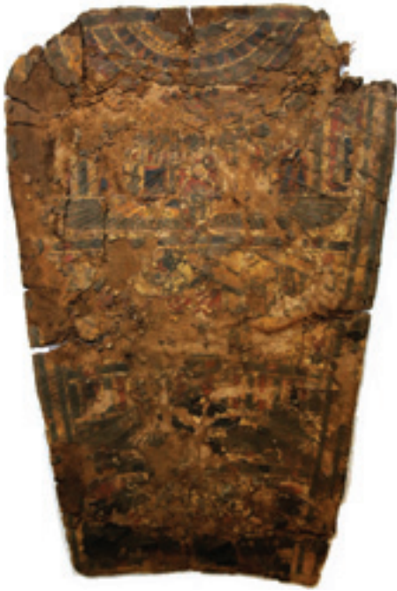
Figure 2. The collar-breast covering

Greco-Roman times as the municipal necropolis of Crocodilopolis/Arsinoe (Petrie, Wainwright and Mackay 1912). Examples of similar helmet masks emerged in large numbers following the initial investigation of the site in the late 1880's (Petrie 1889). The striping of the lappets in this example contrasts with many other masks of the general class that contain motifs within the lappet area, most notably images of Osiris (Osiroid figures seated upon shrines) common at Tebtynis (e.g. James 1982, 175, Fig. 80). 11