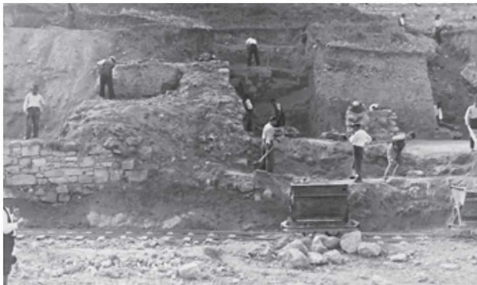
Slika 6. Arheološki radovi na Kalemegdanu, ANM