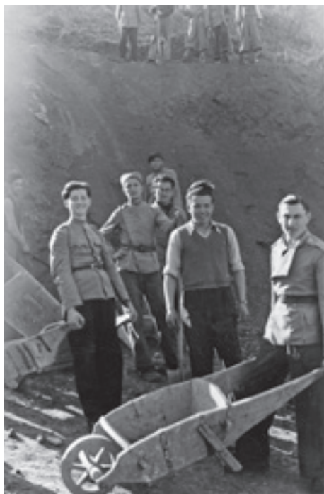
Slika 7. Milutin Garašanin (u sredini) i obveznici Nacionalne službe za obnovu Srbije, ANM

Kalemegdanu „sa motikom i ašovom“ nije „obrađivala rodnu grudu“, kako je to pisao Marčetić, već je suštinski i ne znajući, učestvovala u imperijalističkom projektu aproprijacije kulturnog nasleđa.