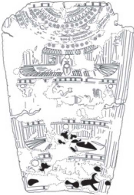
Figure 3. Organization of vignettes and motifs on the conjoined collar-breast covering

gest that the group of crouching deities included Ra and possibly Osiris, Isis and Nephthys.