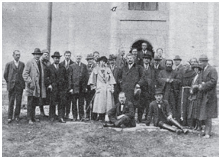
Slika 2. Skup arheologa u Beogradu (Ilustrovani list 1922b, 2)