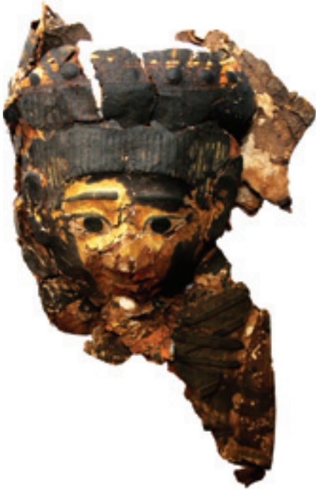
Figure 1. Helmet-type mask

The mummy mask (Fig. 1) is of approximate maximum height 41.5 cm and thickness 0.2–0.85 cm. It is of so-called helmet-type. In other words, it is a head cover that was literally placed all around the mummy's head. The inner surface of the mask is also gessoed. The face of the mask – idealized and youthful with stylized facial features – is gilded with painted eyes with black centers which are edged in greenish-gray, which matches the eyebrows. A thicker line is provided on the top side of the eye. The ears are modeled in relief 6 and are fairly large. 7 The hair, indicated by green-gray stripes on a light (whitish) ground is arranged in bangs. These terminate in rounded, J-shaped curls. The paint is laid on thickly and this was done deliberately to create a schematic texture.